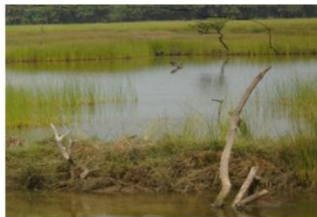
Figure 3 : Tapis herbacé à Cyperus esculentus (Jaman) Figure 4 : Tapis herbacée (Essonolit)

Dans le terroir d' Ebrouay , les quatre espèces de palétuviers sont rencontrées en peuplements relativement denses dans les étangs piscicoles ( Figure 5 ). La taille moyenne des palétuviers y varie entre 0,27 \pm 0,15 m et 3,38 \pm 1,01 m et le taux de recouvrement de 5 à 95 %. Les sujets adultes présentent des densités comprises entre 467 et 1600 individus/Ha. Celles de la régénération naturelle fluctuent entre 1526,6 et 607875 individus/Ha. La régénération naturelle dotée de racines échasses a été notée dans 21,7 % des étangs piscicoles et celle présentant des pneumatophores dans 17,39 % des cas. La présence de racines échasses et de pneumatophores représente un signe d'adaptation des palétuviers dans les étangs.