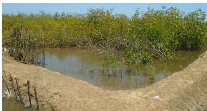
Figure 5 : Palétuviers dans un étang d'Ebrouay

Dans le terroir d' Ebrouay , les quatre espèces de palétuviers sont rencontrées en peuplements relativement denses dans les étangs piscicoles ( Figure 5 ). La taille moyenne des palétuviers y varie entre 0,27 \pm 0,15 m et 3,38 \pm 1,01 m et le taux de recouvrement de 5 à 95 %. Les sujets adultes présentent des densités comprises entre 467 et 1600 individus/Ha. Celles de la régénération naturelle fluctuent entre 1526,6 et 607875 individus/Ha. La régénération naturelle dotée de racines échasses a été notée dans 21,7 % des étangs piscicoles et celle présentant des pneumatophores dans 17,39 % des cas. La présence de racines échasses et de pneumatophores représente un signe d'adaptation des palétuviers dans les étangs.