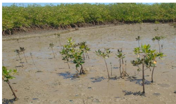
Figure 6 : Plantation de palétuviers dans un étang piscicole

Aux alentours des étangs, la taille moyenne des palétuviers varie entre 1,15 \pm 0,1 m et 4 \pm 0,9 m. Le taux de recouvrement y varie entre 8,75 et 80 % et la densité des sujets adultes de 70 à 13800 individus/Ha. La densité de la régénération naturelle y est comprise entre 10 et 43000 individus/Ha. La présence d'espèces herbacées d'eau douce comme Phragmites sp. et Typha domengensis a été notée dans 17,39 % des étangs et témoigne de la faible salinité des eaux stockées. Dans les étangs, la présence et la vigueur des palétuviers plantés est aussi une preuve de l'intégration dans étangs dans la mangrove ( Figure 6 ).