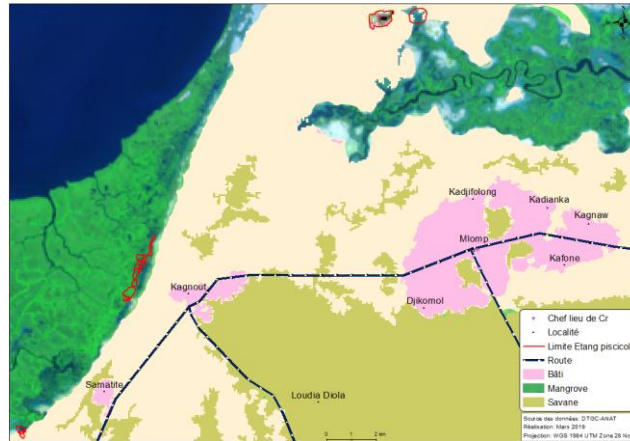
Figure 1 : Carte de localisation des étangs piscicoles de la Zone de Mlomp