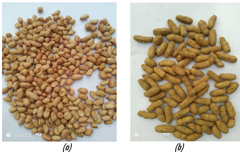
Figure 1 : Arachide décortiqué (a), Arachide non décortiqué (b)

Le matériel de l'expérimentation était les graines d'arachide ( Arachis hypogaea L.) achetées au marché de NKOLO MISSION ; La variété était une souche locale (Ngavuka) ( Figure 1 ).